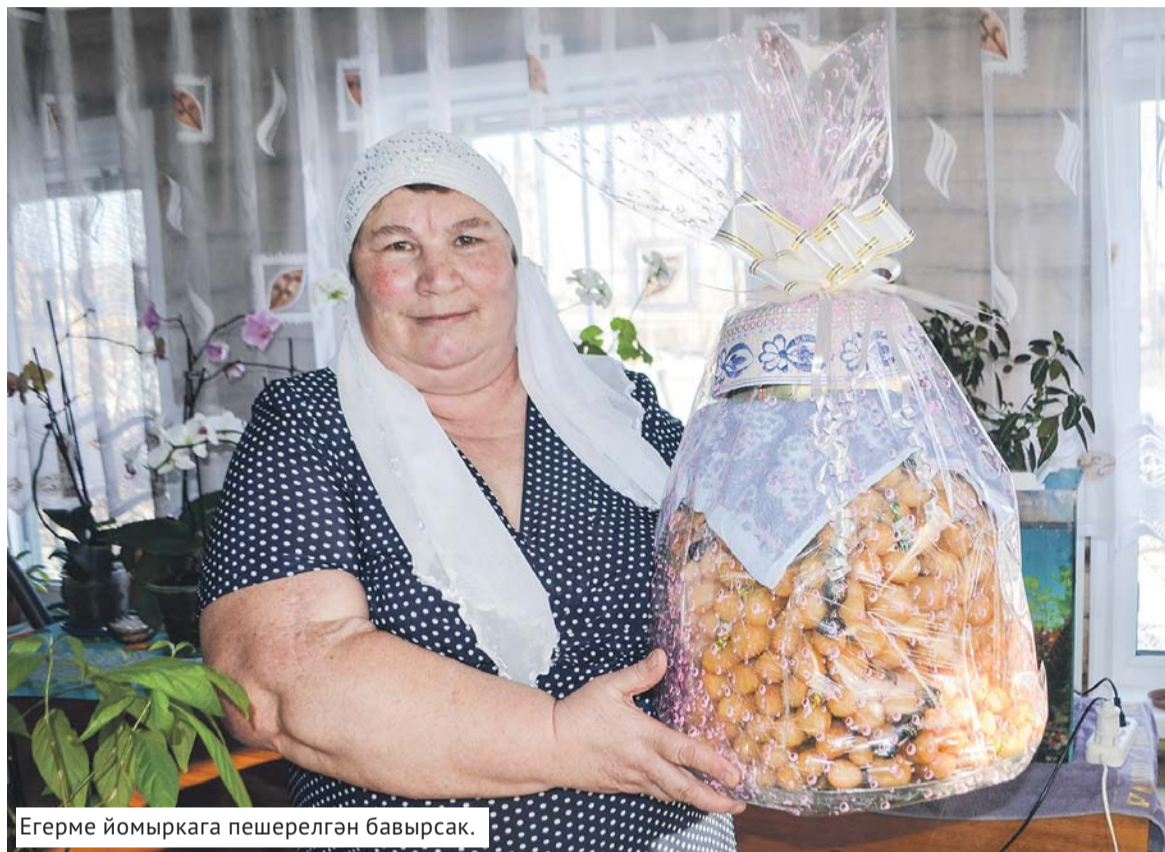
Егерме йомыркага пешерелгән бавырсак.

«ШК» журналисты бавырсак пешерергә өйрәнде