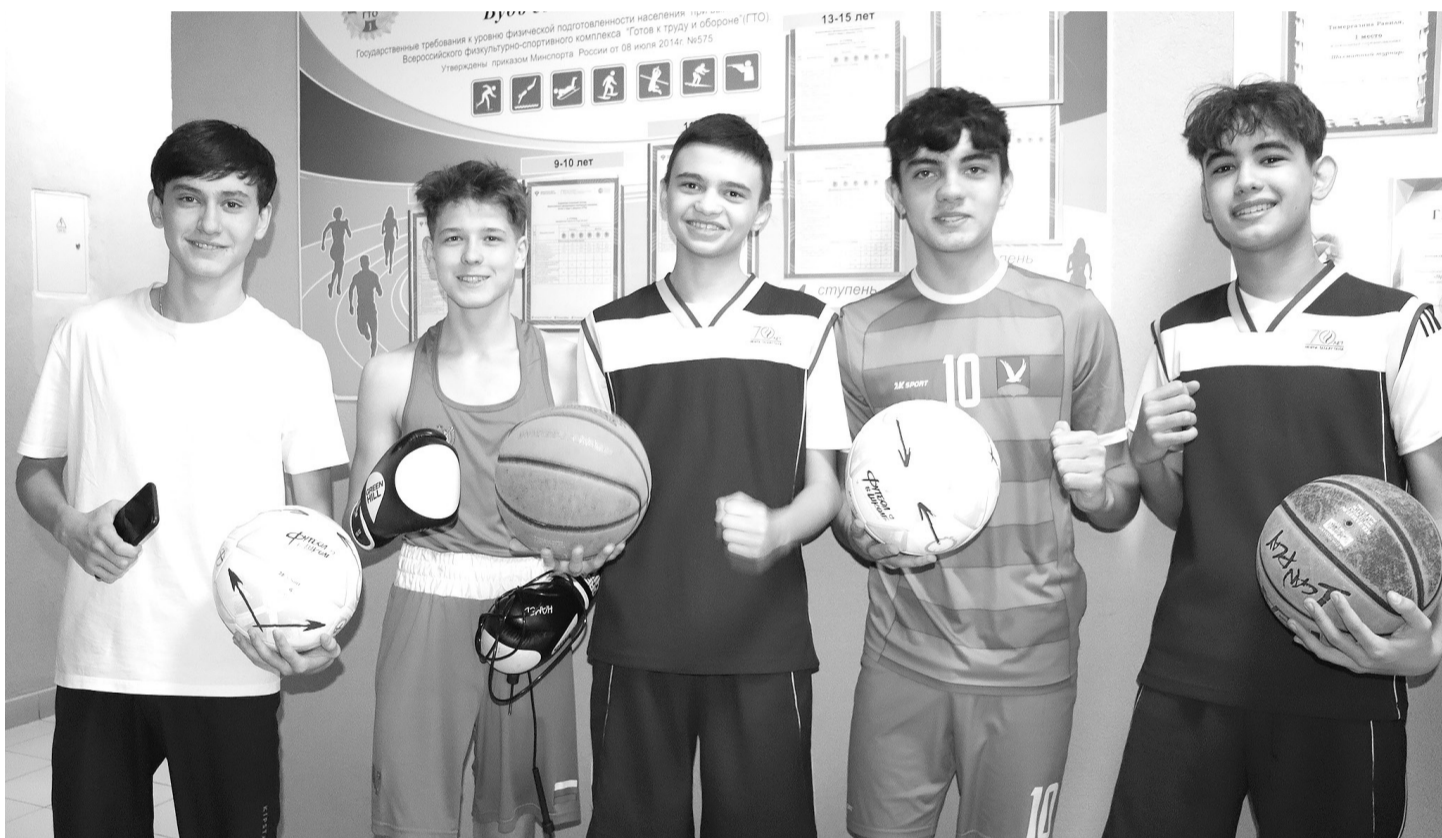
Учащиеся Азнакаевской средней школы №1 любят спорт.