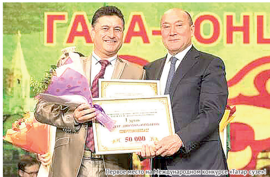
Первое место на Международном конкурсе «Татар сузе»!

– Получается, Вы пришли в свою профессию окольными путями?