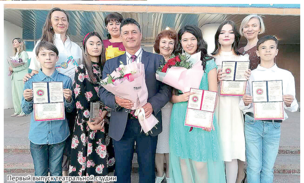
Первый выпуск театральной студии

– Не трудно ли городским ребятам исполнять роли на татарском языке?