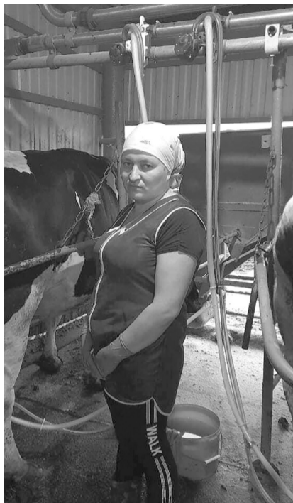
■ Фото: Лилия Миннеханова И.Габидуллина КФХда алыштыргысыз савымчы

– Житәрлек күләмдә терлек азыгы әзерләдек. Компьютерда программалаштырылган махсус жиһазда (миксерда) килограммын килограммга туры китереп, төрле азыктан баланслаштырылган тулкылы катнашма ясала һәм сыер-