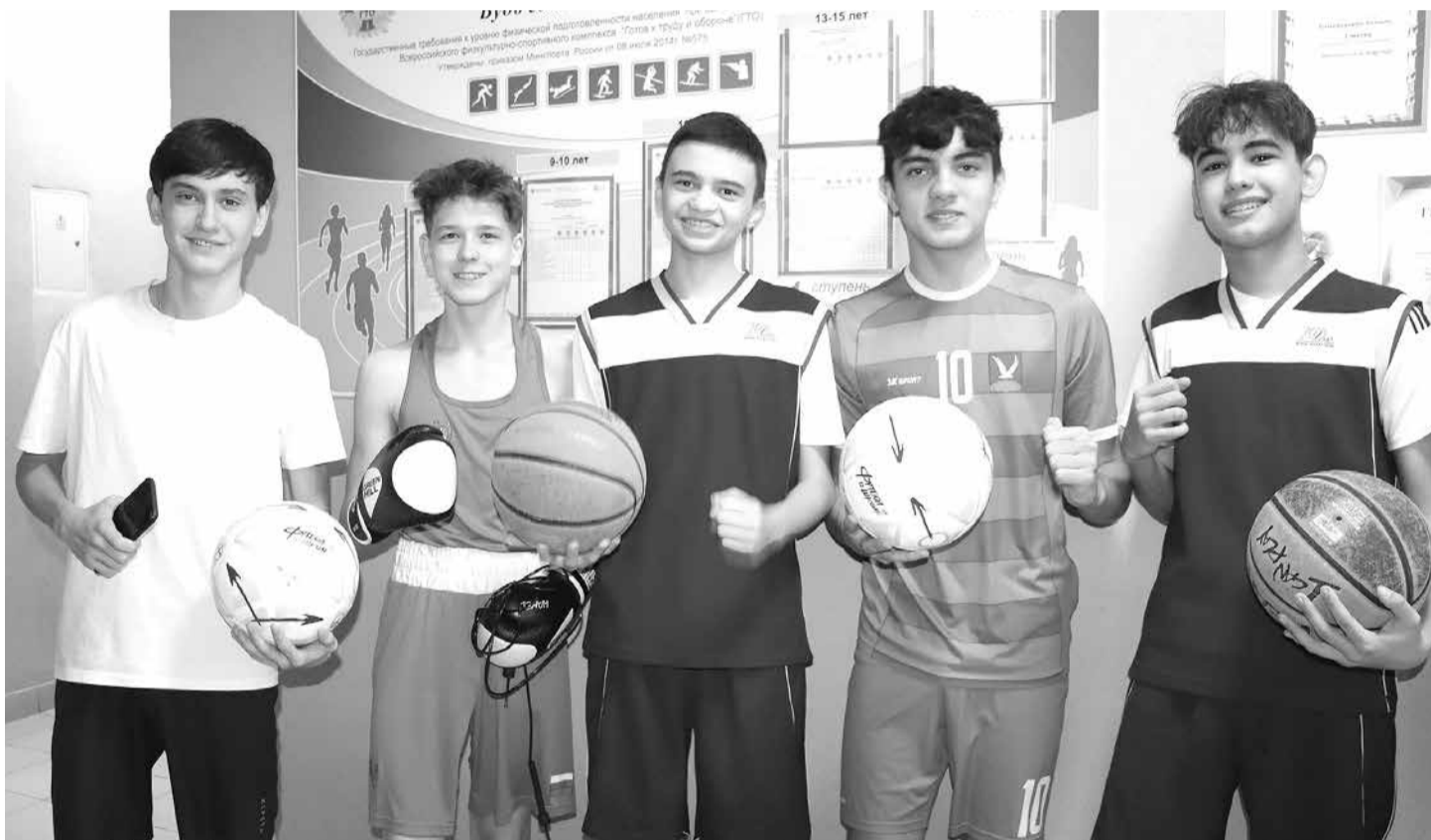
Азнакай 1 нче мәктәбе укучылары спорт ярата.

Социаль-гуманитар белем бирү үзегә доценты, педагогия фәннәре кандидаты