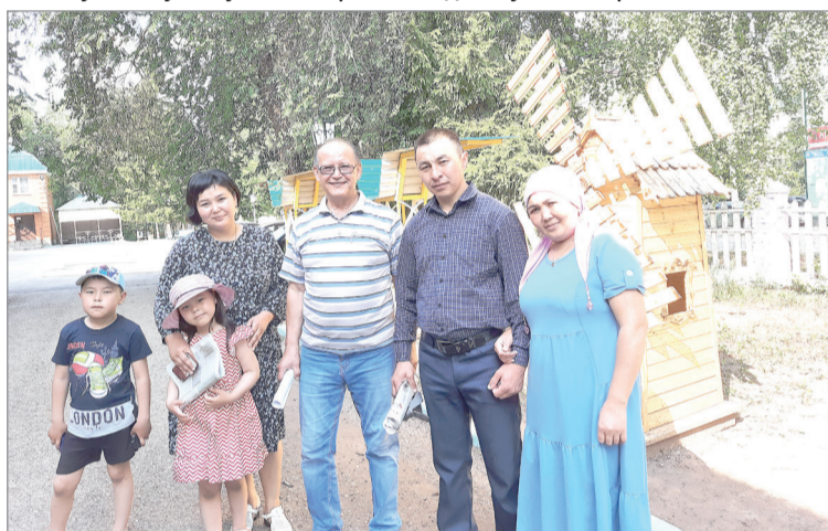
Отдыхающие из Алтая.

«Впитанный в кровь» запах газеты привел его, студента мединститута, в журнал «Чаян». По заданию редакции он, бегая по предприятиям, искал интересные материалы для журнала «Чаян» и находил их.