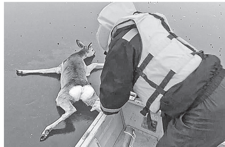
Молодая козуля вышла на лед и не могла встать

Всероссийская экологическая акция «Покормите птиц зимой!» проводится ежегодно, начиная с 12 ноября и на протяжении всей зимы. В это время люди подкармливают синиц, щеглов, снегирей, соек, чечеток и свиристелей. Активисты заготавливают корм для птиц и развешивают кормушки.