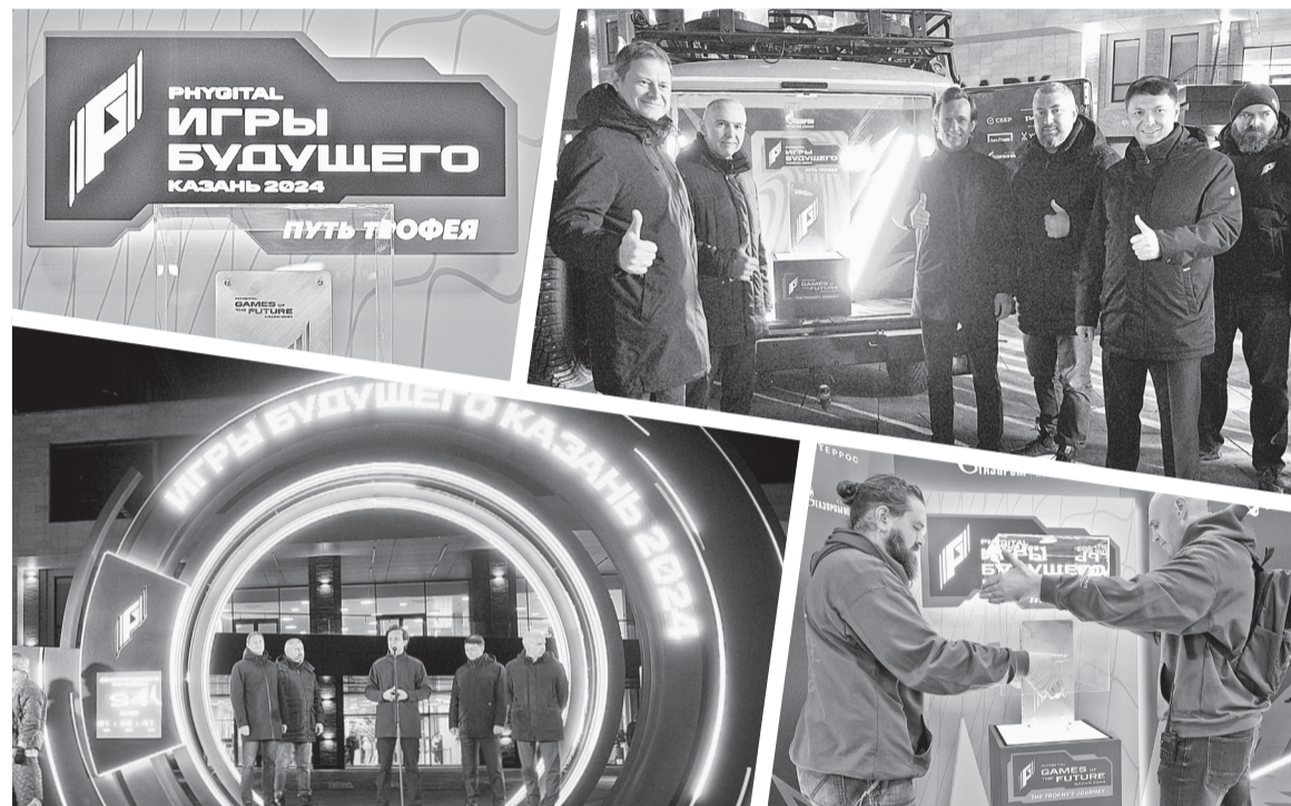
■ «Игры будущего» пройдут в Казани с 21 февраля по 3 марта 2024 года

В столице Татарстана встретили трофей «Игр будущего».