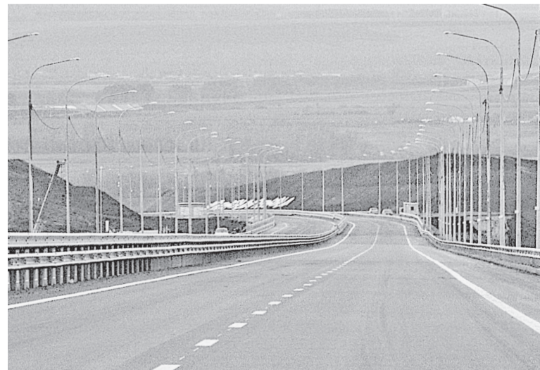
■ В Татарстане открыли первый участок трассы М12