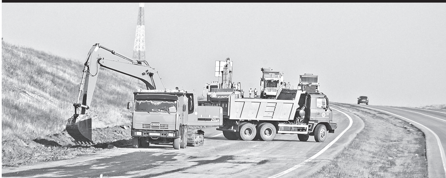
По словам министра, 2023 год сложился для дорожников республики удачно