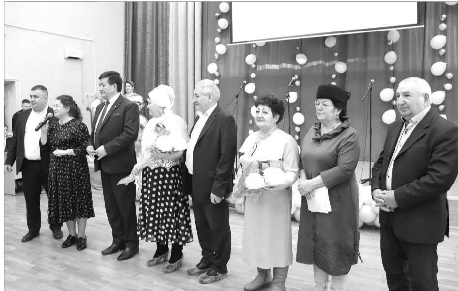
■ Группа выпускников школы.

– Еще недавно мы торжественно и радостно отмечали 100-летие школы.