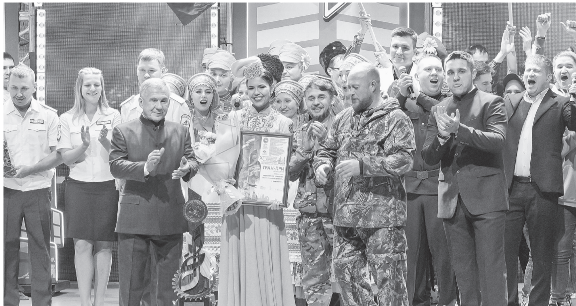
Участников торжества поприветствовал Раис Татарстана Рустам Минниханов

- Самое главное для государства - это человек труда. Мы видим развитие фестиваля и поддержку у руководителей предприятий. Мы создали систему, благодаря которой все больше предприятий присоединяются к этому фестивалю. Но если руководители производств в этом не заинтересованы, ничего не получится. Хочу поблагодарить их за создание необходимых условий для рабочих кол-