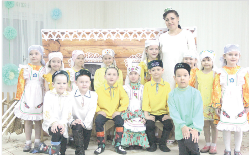
Юные артисты со своим воспитателем.

– Моя цель – научить правильно пользоваться грамматическими формами, благодаря театру развивать ораторское искусство. С детства мы должны помнить о том, что язык – это главное достояние народа, важно привить любовь к родному языку и бережно относиться к нему. Театр создает условия естественного учеб-