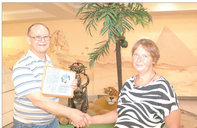
Получать путевку в санаторий за подписку очень приятно.